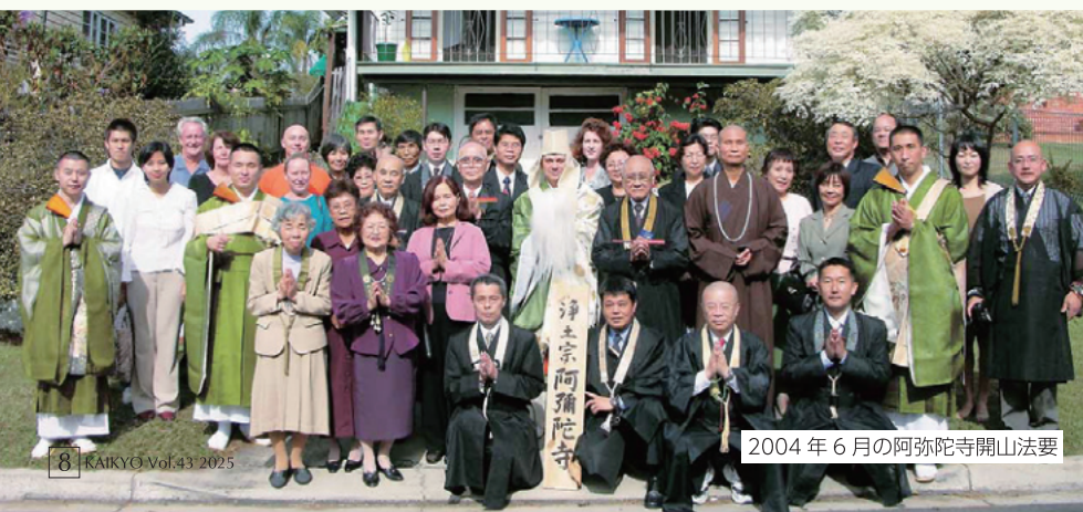
2004年6月の阿彌陀寺開山法要