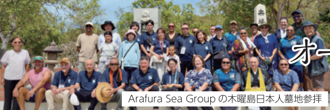
Arafura Sea Groupの木曜島日本人墓地参拝