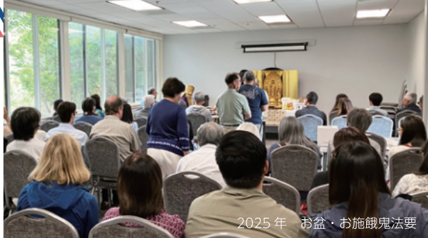
2025年 お盆・お施餓鬼法要

日本では、どこへ行っても安全は当たり前のように感じられますが、多民族・複合文化社会アメリカにおける安全は、高い代価を払って初めて求めることが可能となります。外から日本を観ると、海外では考えられないような貴重な文化・伝統が多く存続していることが分かります。北米本区では、この安全性を念頭に二度目の移転に臨んでいます。皆様のご理解ご支援をお願い申し上げる次第です。