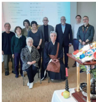
パリでの花まつり

帰敬式における「懺悔」は大切な儀式ですが、キリスト教の告解や懺悔のように「神」に許しを求めるのではなく、自分自身のカルマからの浄化に関するものです。自分自身と仏様と二人きりで、瞋り・貪欲・妄想によって積み重なったカルマを反省し、仏道を歩むにあたり自身の心の浄化を誓うものです。七仏通誡偈の「自