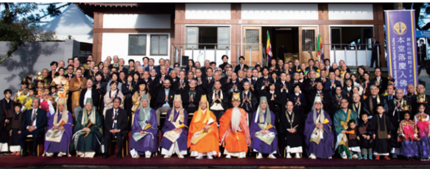
クリチバ日伯寺落慶法要記念写真

信仰と絆の輪をさらに広げて まいります。今日までご支援 くださった皆様に心より感謝 申し上げます。今後も一層の ご協力とご指導を賜りますよ う、何卒よろしくお願い申し 上げます。