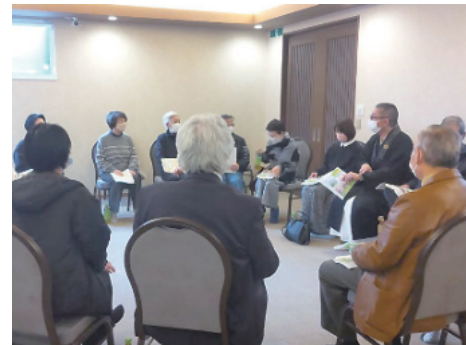
ひとやすみカフェ

社会情勢の変化として、データから見ても仏式での葬儀の需要は減ってきているようで、核家族化や単身世帯の増加、地域コミュニティの希薄化により、寺院と人との継続的な関係が築きにくい