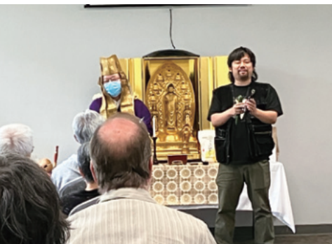
法要にて檀信徒のスピーチ