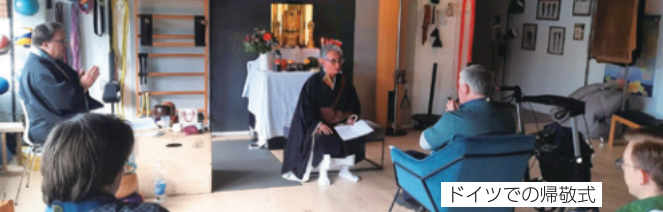
ドイツでの帰敬式