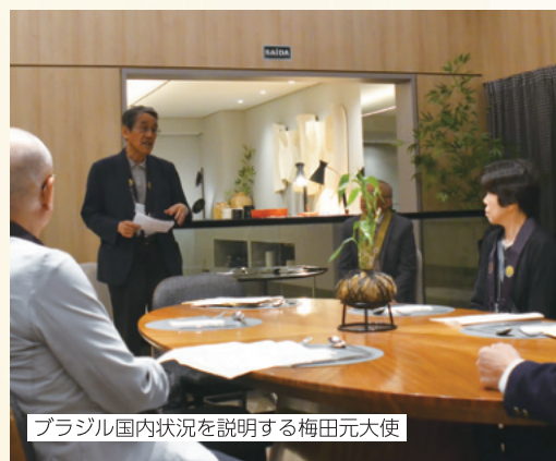
ブラジル国内状況を説明する梅田元大使