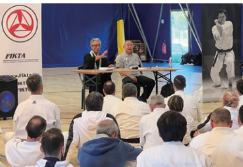
ミラノでの講話会