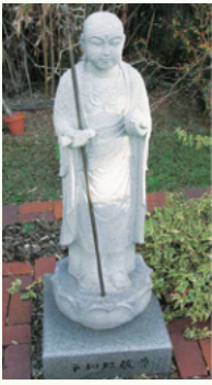
寄贈された地藏像