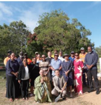
木曜島の墓標修復完了

私たちの幸せは、相手との関係性で高まるのではないでしょう。これは、私が阿弥陀寺にお見えになる方々を見てきて感じたことです。こちらでの主な行事は「お彼岸・お盆・写経会」がありますが、参加した方々の気持ちや穏やかで快い気持ちになっているのを見えます。厳かに読経に聞き入る、唱える、そしてその後の楽しいお茶会での時間。個人個人の結びつきがあつて知り合う「縁」を阿弥陀さまが照らしてお導きになっています。