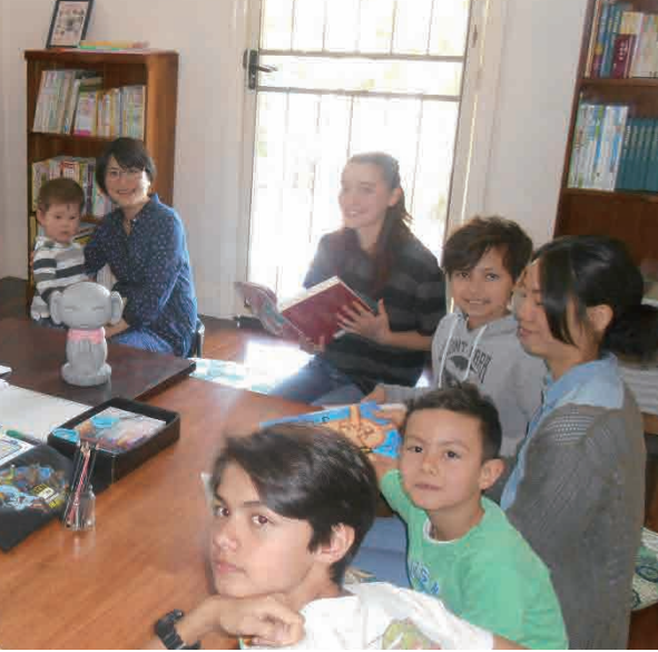
感謝申し上げます

とるのが難しいことが時々あります。そのため、子供たちをバイリンガルに育てるには正しい日本語を教える必要があります。そして寺子屋に参加することで日本の文化と繋がります。この場合、日本語を学べるだけでなく、日本人とその文化についても理解が深まります。他民族国家であるオーストラリア人として、この国以外の