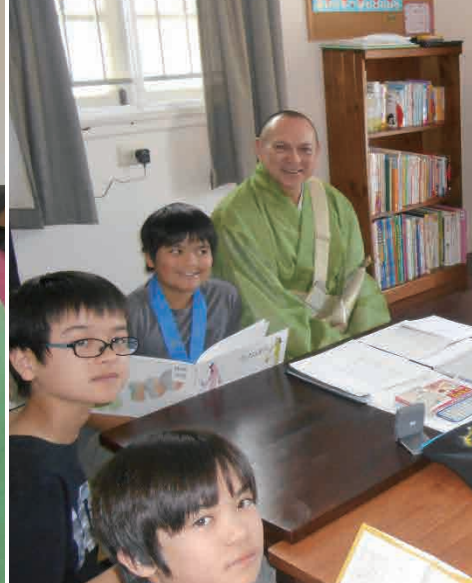
絵本の寄贈にご協力くださいましたみなさまに、心より