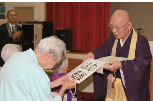
2012年 敬老ホームを慰問される伊藤猥下