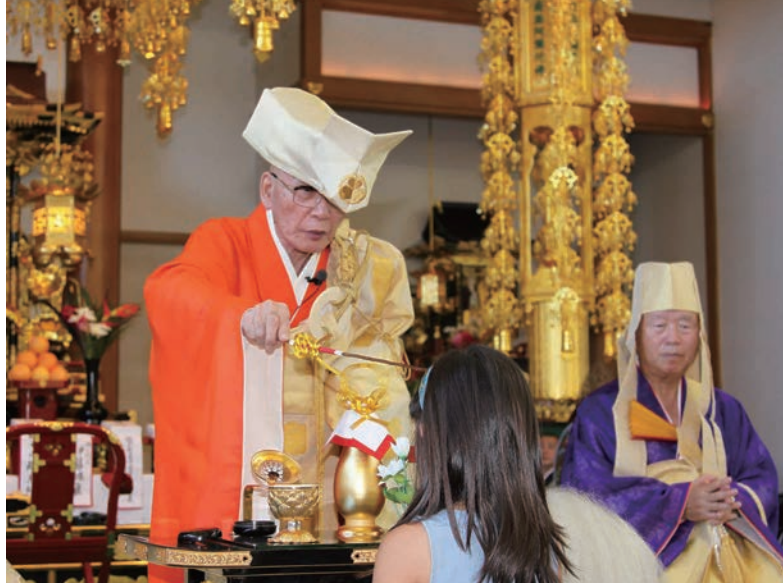
2012年 法然上人800年大遠忌法要

こうした記念法要と共に、本院では年間通常法要・水子供養・各種祈願・老人ホーム慰問・ラジオ法話・別時念仏会・コラム掲載等の教化活動を行っています。年間法要では参詣者数が少しずつ増え、昨今では50名を超えるようになり、全員が大きな声で「南無阿弥陀仏」と称え