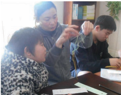
七夕の飾りつけをしました

寺子屋開始時は順調でしたが、授業が進むと蔵書の痛みや、また新刊が少ないことがら読み聞かせの素材不足に悩みました。そこで、日本に寄付の依頼をしました。社会国際局が中心となってメッセー지를送り、短期間の間になんと約300冊の本が集まりました。速さとその数に、嬉しさと驚きを隠せませんでした。寺子屋事業にご理解をいただき寄付をしてくださった寺院、学生、檀信徒の方々には、感謝の気持ちでいっぱいです。子供達に日本のやさしい心や、お念仏の心を伝えるため、大いに活用していきます。本当にありがとうございました。