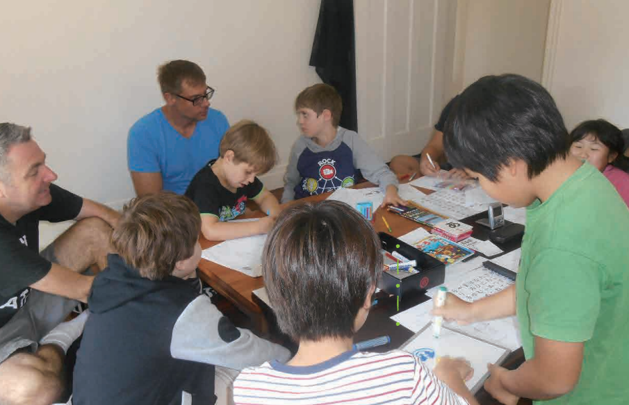
ひらがなの授業風景