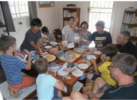
授業が終わるとみんなでおやつをいただきます

コインを頂いています。オーストラリアでは、1ドル硬貨と2ドル硬貨が金色をしていて、ゴールドコインとはそのどちらかを指します。私がこれに決めたのは、寺子屋は誰もが利用できる場であり、金銭的な理由で来れなくなる人がいてはいけないと思うからです。そして偶然にも、ゴールドは極楽の色でもあります。少額ではありますが、皆から集めたお金でコピー代、茶菓子代は十分に補えます。