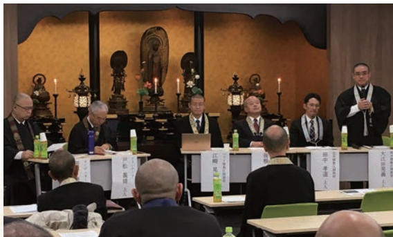
海外開教の現状を話す開教総監・開教使

最後に、海外開教区の総監、開教使の方々から日頃の活動が報告された。海外では先祖供養が一般的ではなく、メンバーの方々とは法要の時だけではなく、日常的に交流することが普通で、入院中でも法衣のままでお見舞いに行き、病院でもそれが受け入れられている。生前から深い信頼関係が構築されているからこそ、このようなことができるらしい。なにしろ教師とメンバーとの垣根が低いのだ。日頃からのつながりを大切にしてきた結果である。将来はSNSによる布教活動にも目を向けている。そのネットワーク内では様々な質問・相談が飛び交う。仏教に関して興味のある方が訪れられる