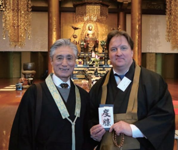
大本山増上寺にて

彼と当地メンバーの方々と共に法然上人の念仏の教えを学び、それを行じることを楽しみにしていると思う。