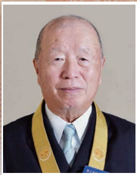
浄土宗開教振興協会会長 浄土宗宗務総長