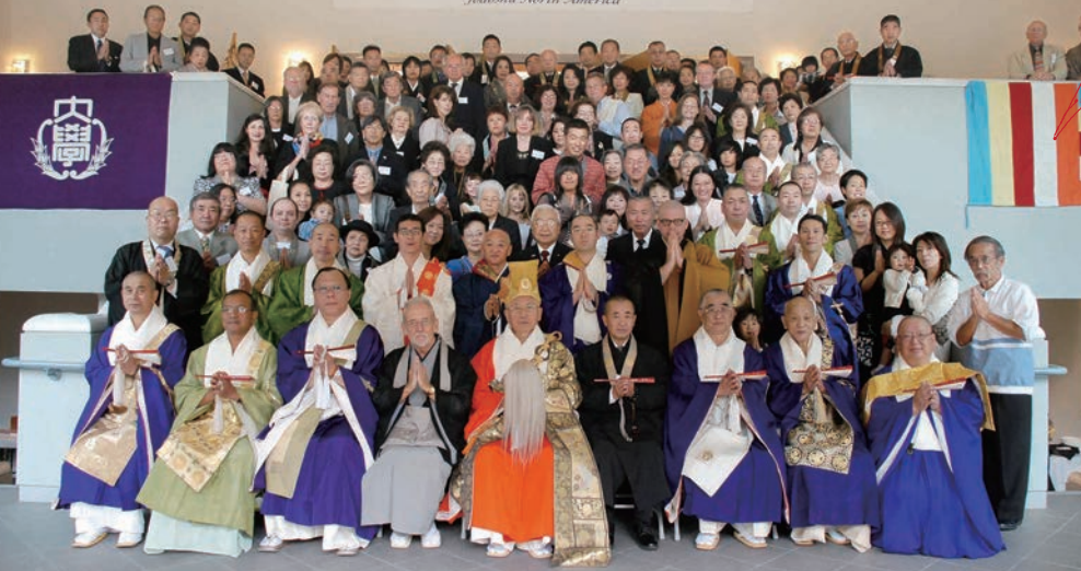
2007年 浄土宗北米開教70周年記念法要

浄土宗開教使の本義は「阿彌陀仏の本願を信じ、一人でも多くの方々にお念仏を称えていただく努力をする」ことにあります。檀家制度や伝統のない海外の地、さらには異なる宗教・言語を有する文化圏での開教は困難を伴います。皆様ご承知の通り、北米開教区では2003年から2008年まで5年間に及ぶ裁判を経験しました。教団は割れ、メンバーは去り、地域社会における浄土宗への信頼を大きく傷つけました。当時、松本眞岳元社会国際局長は何度もロスに足を運ばれ問題解決に奔走されました。続く谷地玄雅元社会国際局長は、北米総監の職を受け浄土宗の信頼回復のためにロス・日本・ハワイから総勢200名を超える参詣者を集め、2007年11月に稲岡康純元宗務総長を導師にお迎えし『北米開教70周年記念法要』を厳修しました。法要後のランチで、稲岡総長がロスの檀信徒