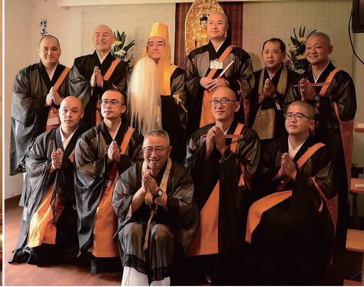
日本と南米の僧侶